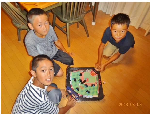
▲ホワイトマナーズ 岩橋家