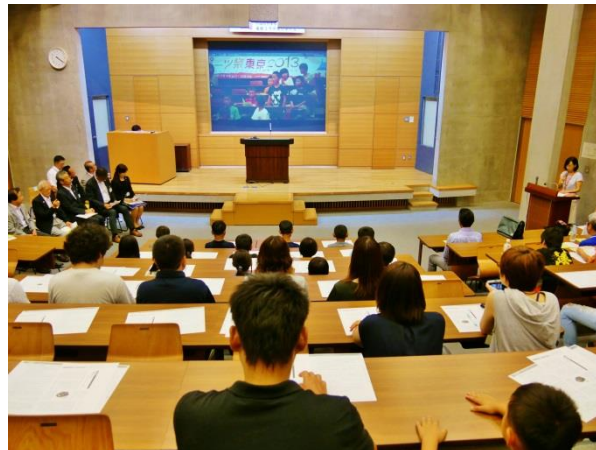
▲6年前を映像で振り返る