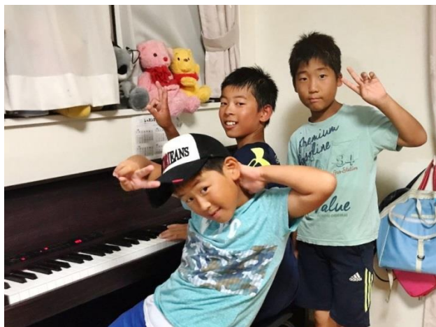
▲ブラックキャッツ 築島家