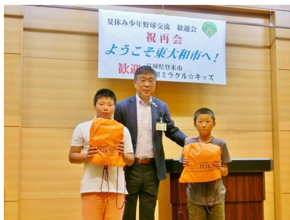
▲主催者(都体協・並木理事長)から記念品贈呈