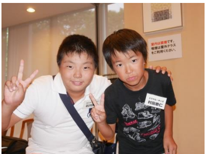
▲すでに兄弟のように（左：高橋家、中：岩橋家、右、石川家）