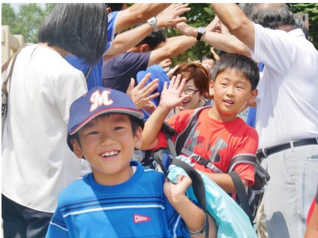
▲みんなでお見送り