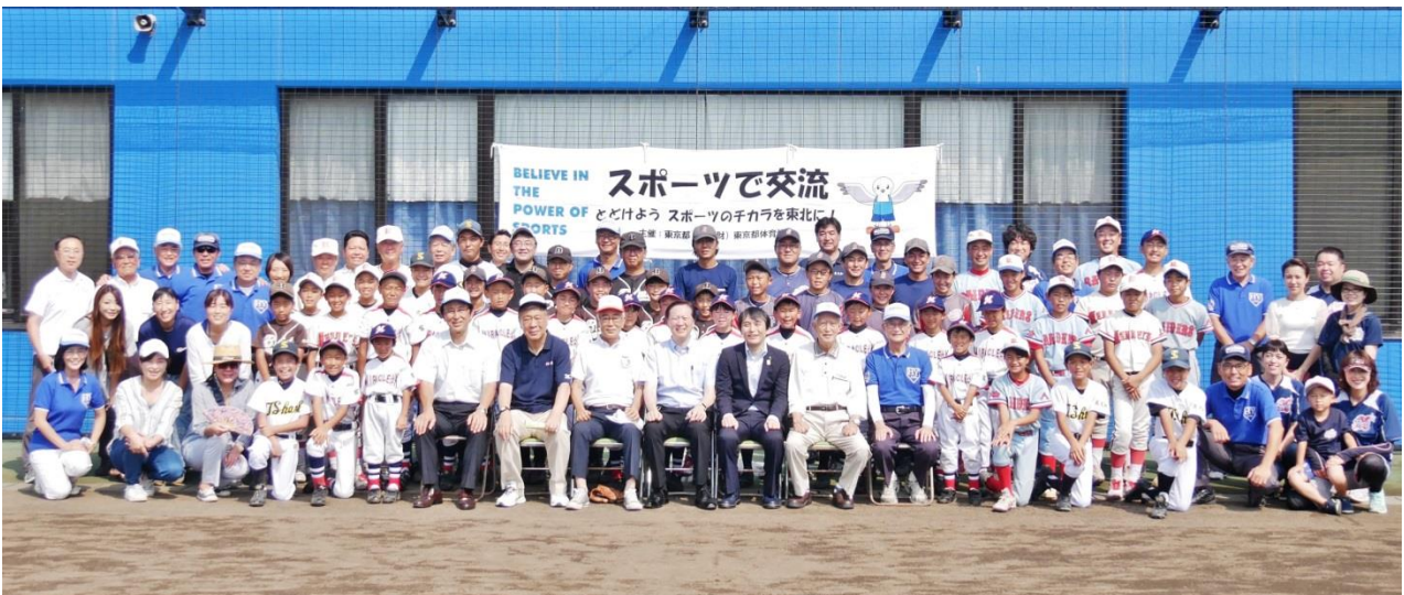
▲関係者との記念ショット