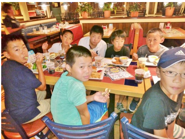
▲ホワイトマナーズ 石川家