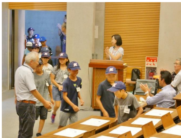
▲歓迎会の会場に入る選手たち