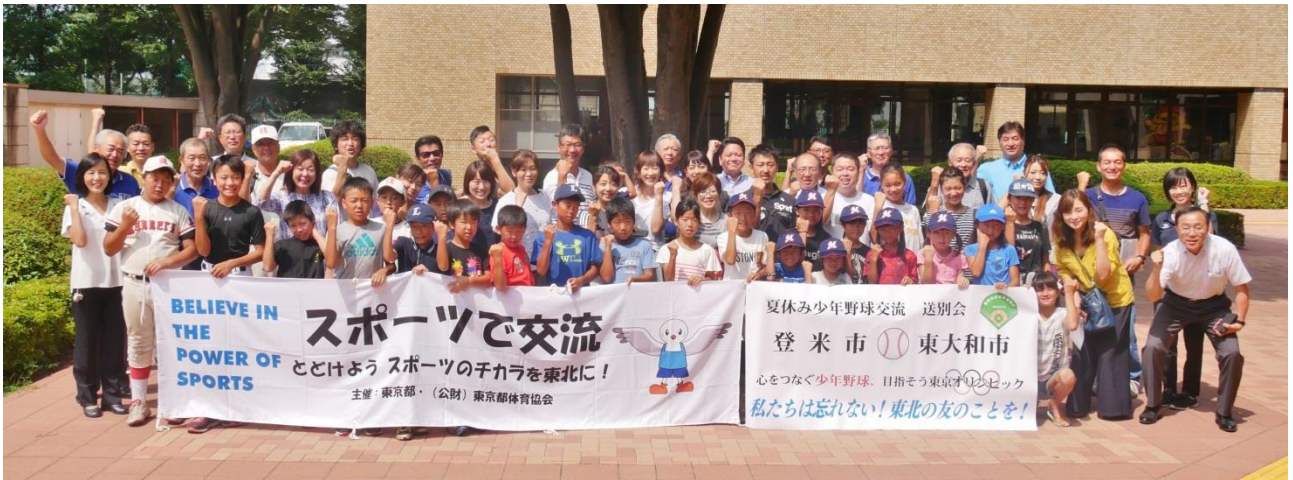
▲この絆の永遠の紡ぎを誓って、最後に全員で記念撮影