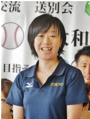
▲主催者挨拶 (都体協・直井課長)