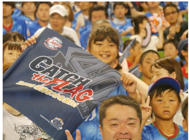
▲思い出をたくさんつくりました