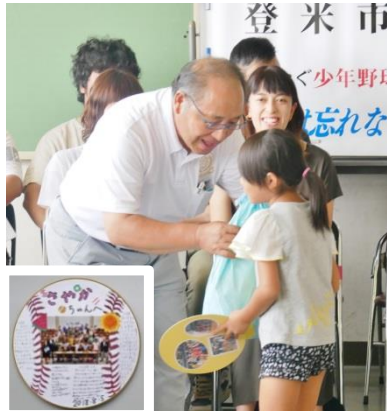
▲色紙のプレゼント