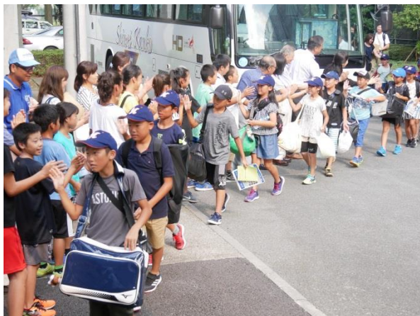
▲歓迎を受ける登米市の選手たち