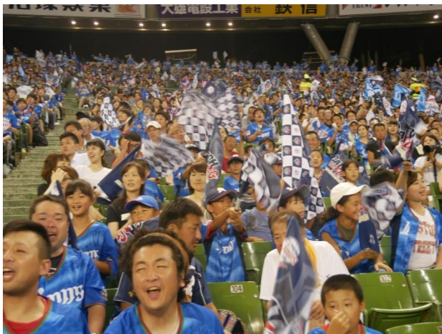
▲全員でプロ野球観戦