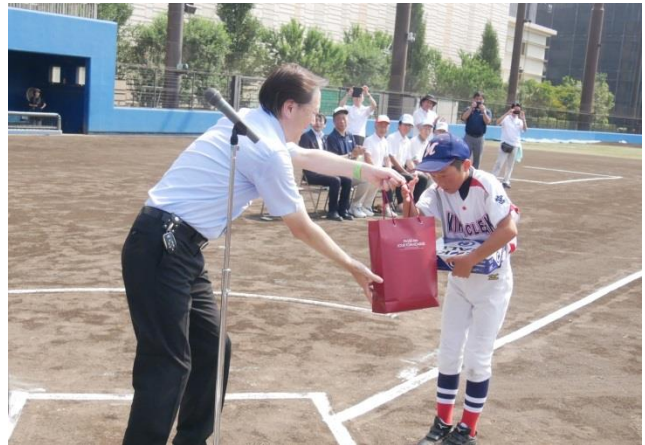
▲谷村実行委員長から記念品贈呈